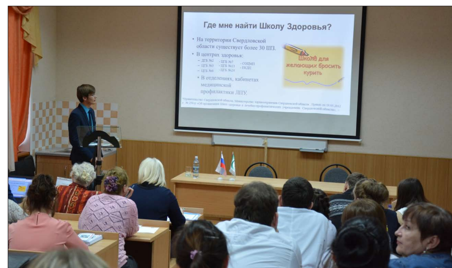
Одна из секций конференции.