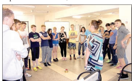
Акция «Твоя жизнь — твоя ответственность».

Важно, что все они строятся по межведомственному принципу, когда заняты все субъекты системы профилактики. Вспомним «Антинаркотический десант «Школа — территория безопасности». Отличительная его черта — адресность. Объектом десанта стали школы, где были выявлены случаи острого отравления подростков психоактивными наркотическими веществами. Отсюда и целевые группы, на которые были направлены мероприятия: обучающиеся, их родители (законные представители) и педагоги. Главным результатом акции стала положительная динамика количества школ — участниц десанта, отражающая снижение количества случаев острого отравления подростков наркотическими веществами.