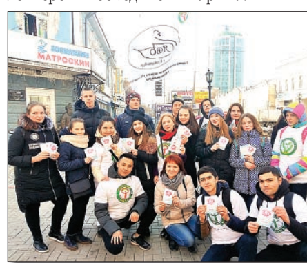
Волонтерский флешмоб «Мама, не кури!», март 2017 г.

В столице Среднего Урала активно работают Ассоциация волонтерских отрядов города Екатеринбурга и Лига волонтерских отрядов учреждений среднего профессионального образования (СПО) Свердловской области под руководством Свердловского областного медицинского колледжа и волонтерских объединений УрГПУ.