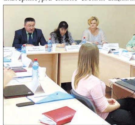
Круглый стол «Безопасный Интернет — детям».

Профилактическое пространство Екатеринбурга сильно своими акциями.