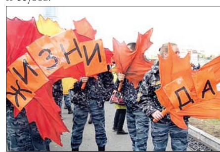
Акция «Жизни — ДА!».

Хорошим подспорьем для выпуска печатной продукции профилактической направленности является конкурс социальной рекламы «Здоровый выбор», который проходит уже не первый год под эгидой Уральского государственного педагогического университета (УрГПУ) в рамках студенческой акции «Жизни — ДА!». Участниками конкурса становятся сами подростки и молодёжь — студенты вузов и сузов.