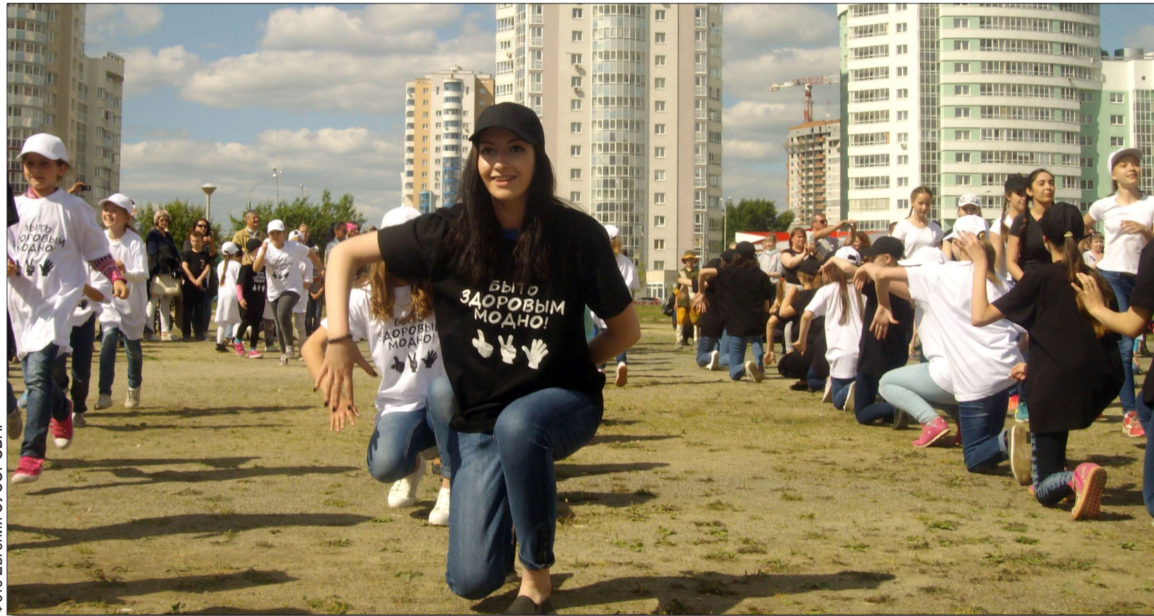
Флешмоб «PRO Чкаловский» собрал в День района больше сотни воспитанников городских оздоровительных лагерей.

Язык уличного танца многогранен и полисемантичен — уж кто-то, а участники акции «Молодёжь без предисловья голосует за здоровье» знают эту истину лучше многих. Ведь акция идёт в районе уже 7-е лето подряд, и число мероприятий