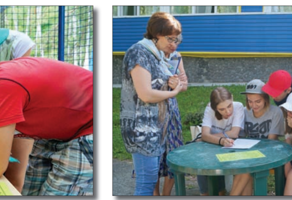
Лагерь «Каменный цветок».