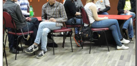
Идёт работа кинолектория «Вся правда жизни».

В номинации «Профилактические ресурсы для молодёжи 16—29 лет» нельзя не отметить проект екатеринбургского Центра психолого-педагогической поддержки несовершеннолетних «Диалог» — интерактивное обучение «Шаг к себе».