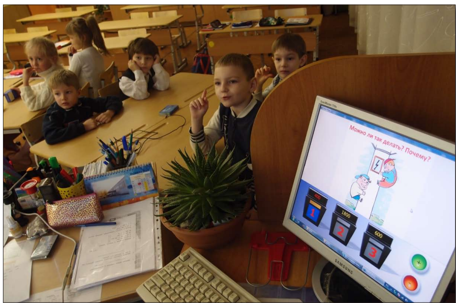
«Своя игра» в школе № 145.

Интерактивный сервис «Карта ума» (сервис spiderscribe.net) — это метод графи-