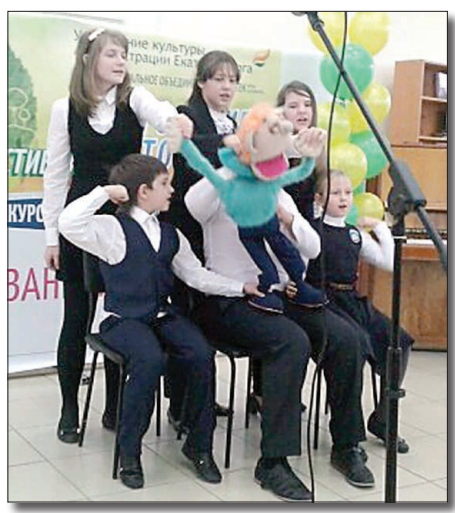
«Чародеи» помогают провести урок профилактической математики.

Из профилактических ресурсов для подростков 13—15 лет мы решили рассказать о тренинге «Математика — против курения», который с успехом реализуют в клубе по месту жительства «Гелиос».