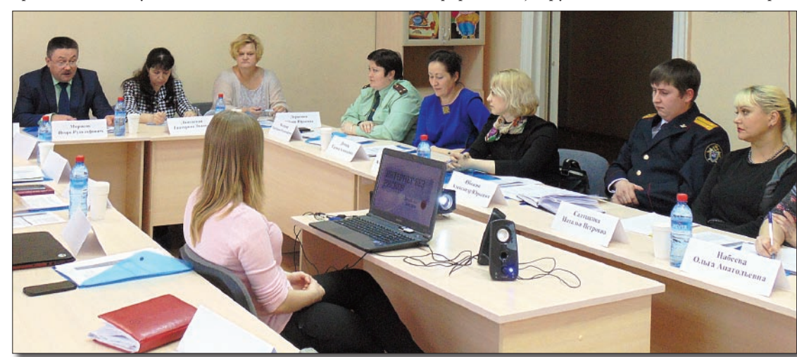
Круглый стол «Интернет без риска».