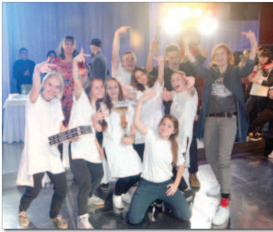
Команда победитель «Тинейджер-шоу 2016» — «Буйный чай».

А вот «10 дней в армии» уже готов перешагнуть границы только Железнодорожного района. В следующем году этот проект планируют сделать городским, включив во всероссийское военно-патриотическое общественное движение «Юнармия». Для этого достигнуто соглашение с Екатеринбургским суворовским военным училищем. В проект попадут подростки со всего города. А ещё поменяется пункт дислокации. Новая воинская часть «для прохождения службы» будет в Елани, куда на летние сборы выезжают суворовцы.