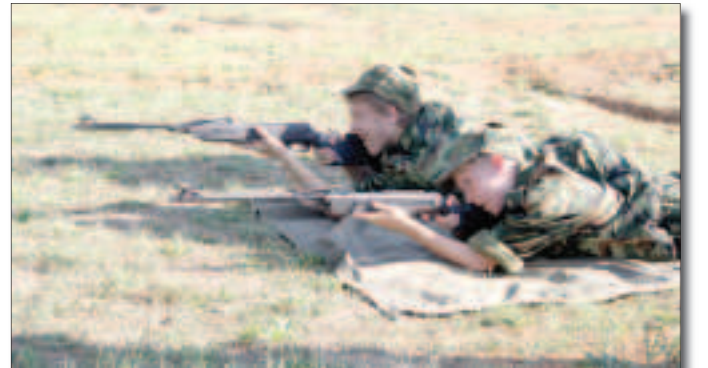
Проект «10 дней в армии».